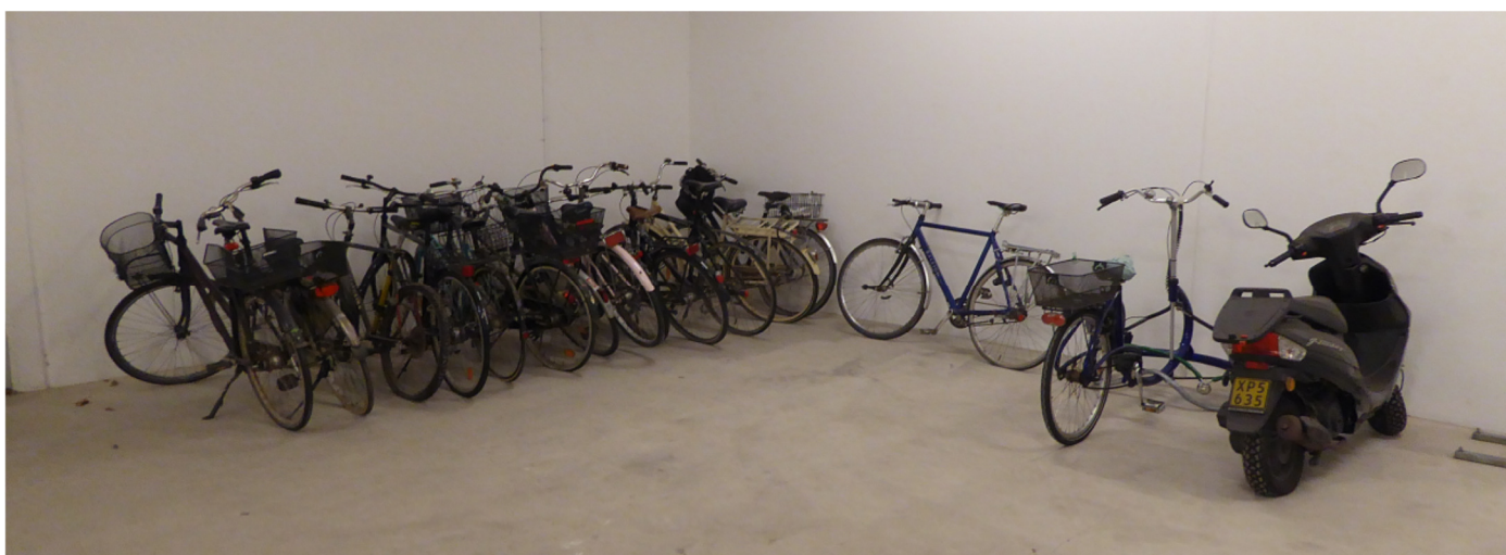
Stort rum under 5H